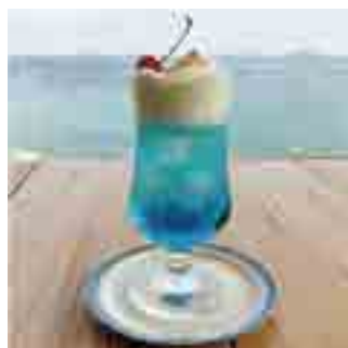
五島ブルーフロート 550yen