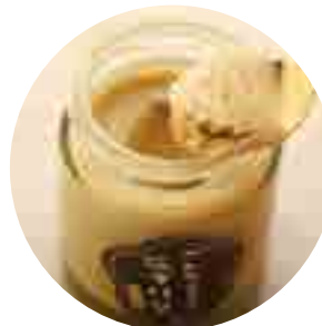
五島で食べる 塩プリン (かんころ味) 420yen