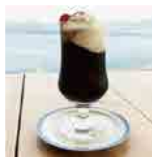
コーヒーフロート 550yen