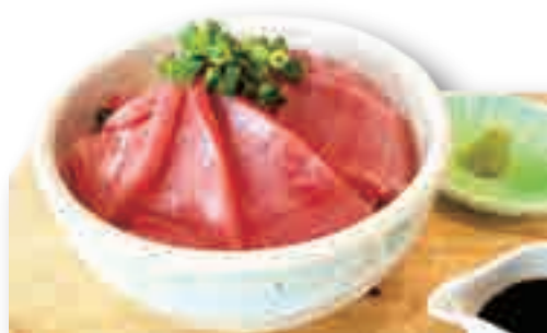
新上五島産 本マグロの中トロ丼 ……………2,000yen