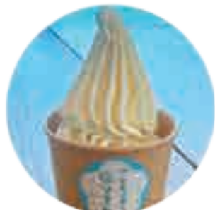
塩で食べる ソフトクリーム 400yen