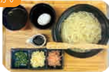
地獄炊き (お一人様用) 1玉・1.5玉・2玉から お選びください 950yen