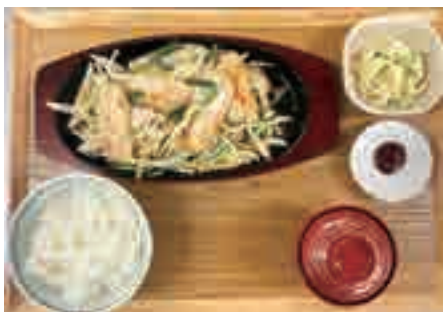
五島豚の 豚トロ旨塩炒 1,280 yen