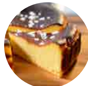
五島列島チーズケーキ 塩あんのう 350yen