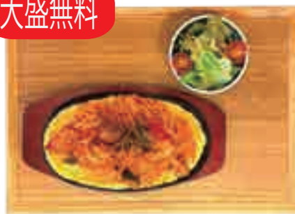
五島うどんナポリタン 980 yen