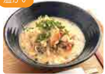
アゴ出汁ちゃんぽんうどん 1玉・1.5玉・2玉から お選びください 980yen