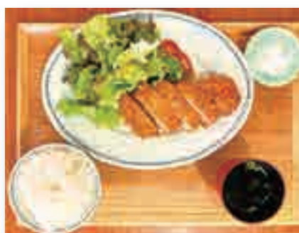
まあるい塩で食べる 五島豚のとんかつ ……………1,420yen