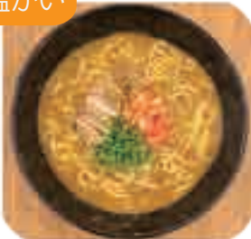
カレーうどん 1玉・1.5玉・2玉から お選びください 880yen