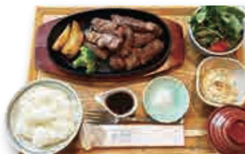
まあるい塩で食べるステーキ ……………2,300yen