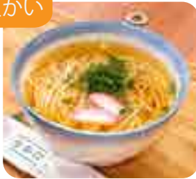
五島うどん 1玉・1.5玉・2玉から お選びください 720yen