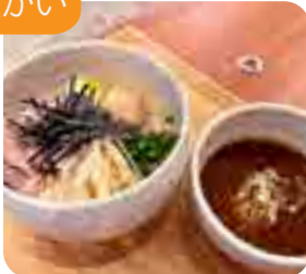
濃厚魚介豚骨つけ麺 1玉・1.5玉・2玉から お選びください 980yen