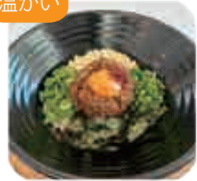
混ぜうどん 1玉・1.5玉・2玉から お選びください 880yen