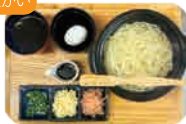
地獄炊き (お一人様用) 1玉・1.5玉・2玉から お選びください 950yen