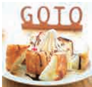
TORAPAN ハニーブレッド .....850yen