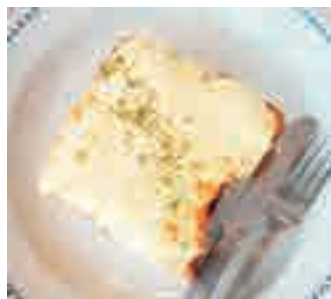
チーズたっぷり TORAPAN チーズトースト .....550yen