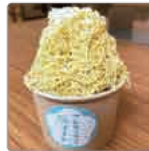
塩で食べる モンブランソフト .....500yen