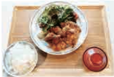
鶏もも塩麴から揚 1,280 yen