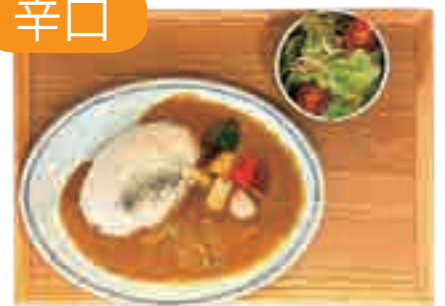
スパイシーアゴ出汁カレー 880 yen