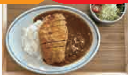
スパイシー五島豚カツカレー ……………1,710yen