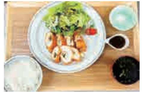
梅しそチーズチキンカツ 1,280 yen