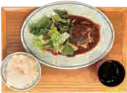
五島牛と五島豚の デミハンバーグ 1,280 yen チーストッピング +150yen