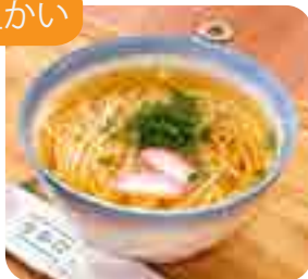
五島うどん 1玉・1.5玉・2玉から お選びください 720yen