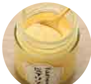
五島で食べる 塩プリン (プレーン) 420yen