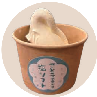
塩で食べる ソフトクリーム 400yen