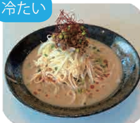
冷製豆乳坦々うどん 1玉・1.5玉・2玉から お選びください 980yen