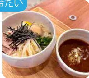
濃厚魚介とんこつ 冷やしつけ麺 1玉・1.5玉・2玉から お選びください 980yen