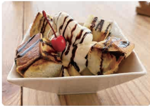
TORAPAN ハニーブレッド .....850yen