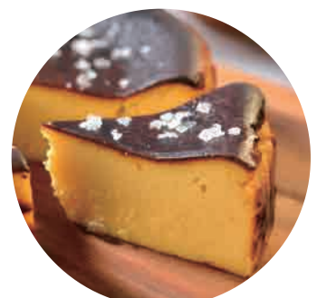
五島列島チーズケーキ 塩あんのう 350yen