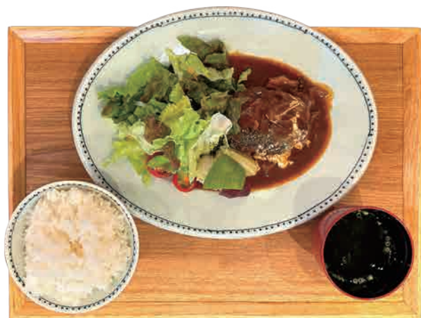
五島牛と五島豚の デミハンバーグ 1,250 yen チーズトッピング +150yen