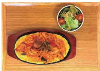
五島うどん ナポリタン 大盛無料 980 yen