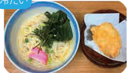
とり天わかめ 冷やし五島うどん 1玉・1.5玉・2玉から お選びください 980yen