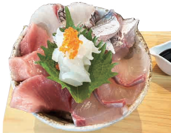
土日 限定 海鮮丼 ……………1,350yen