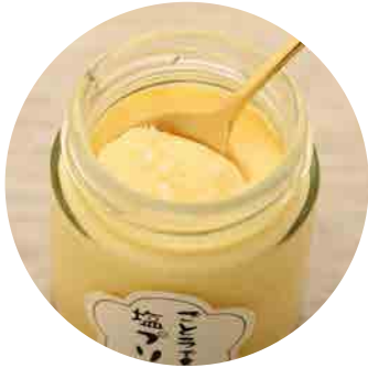
ごとうで食べる塩プリン (プレーン) ……420yen