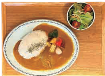
スパイシー アゴ出汁カレー 辛口 880 yen