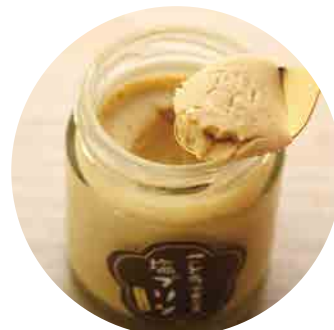
五島で食べる 塩プリン (かんころ味) 420yen