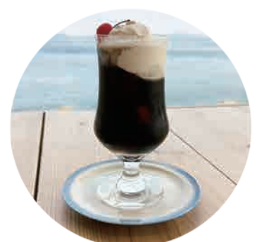
コーヒーフロート 550yen