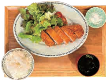
まあい塩で食べる 五島豚とんかつ 1,350 yen