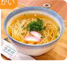
五島うどん 1玉・1.5玉・2玉から お選びください 720yen