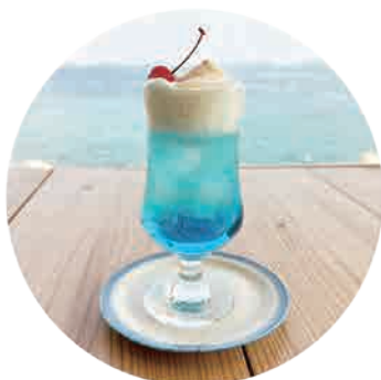
五島ブルーフロート 550yen