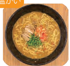
カレーうどん 1玉・1.5玉・2玉から お選びください 880yen