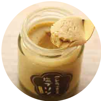
ごとうで食べる塩プリン (かんころ味) …420yen