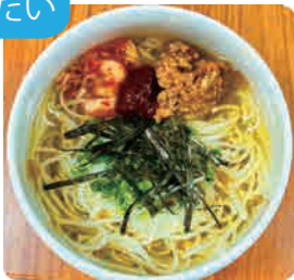
五島うどん冷麺 1玉・1.5玉・2玉から お選びください 980yen