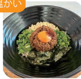
混ぜうどん 1玉・1.5玉・2玉から お選びください 880yen