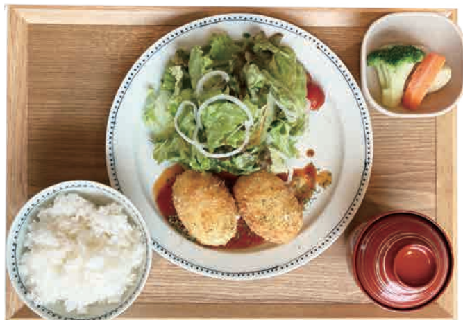
チキンクリームコロッケ 1,250 yen