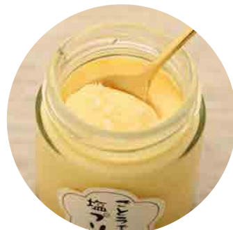
五島で食べる 塩プリン (プレーン) 420yen