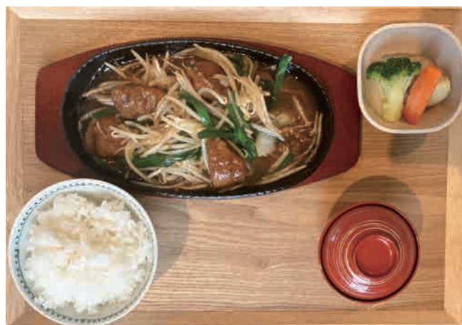
五島牛レバニラ炒め 1,250 yen