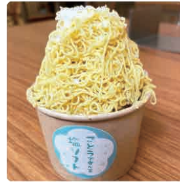
塩で食べるモンブランソフト .....500yen