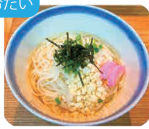
冷やし五島うどん 1玉・1.5玉・2玉から お選びください 720yen