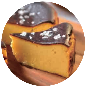
五島列島チーズケーキ塩あんのう ……350yen