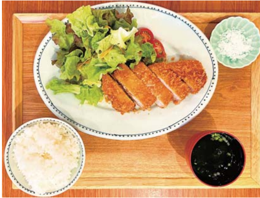
まあるい塩で食べる 五島豚のとんかつ