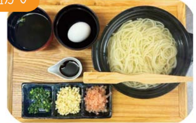
地獄炊き (お一人様用) 1玉・1.5玉・2玉から お選びください 950yen