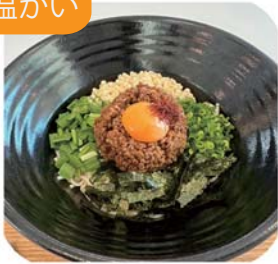
混ぜうどん 1玉・1.5玉・2玉から お選びください 880yen