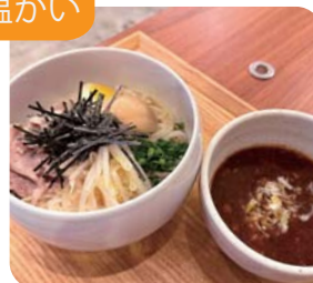
濃厚魚介豚骨つけ麺 1玉・1.5玉・2玉から お選びください 980yen