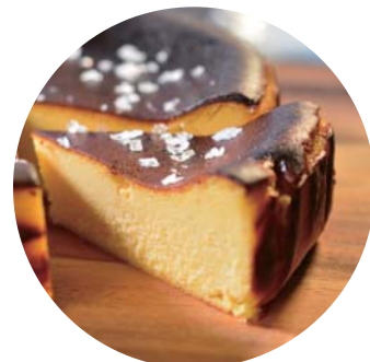
五島列島チーズケーキ 塩あんのう 350yen