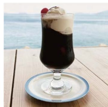
コーヒーフロート 550yen