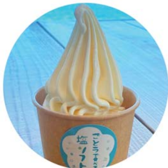
塩で食べる ソフトクリーム 400yen