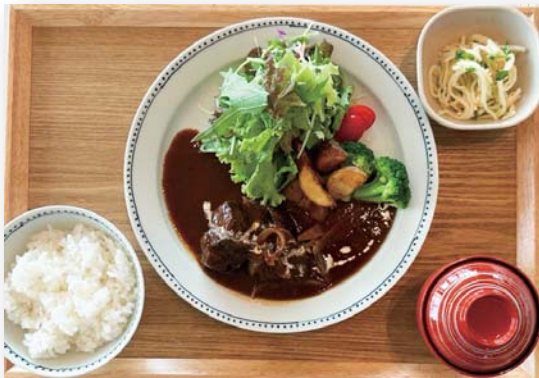
五島牛の赤ワイン煮