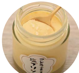
五島で食べる 塩プリン (プレーン) 420yen