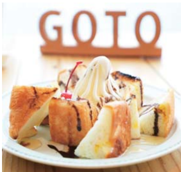
TORAPAN ハニーブレッド ……………850yen