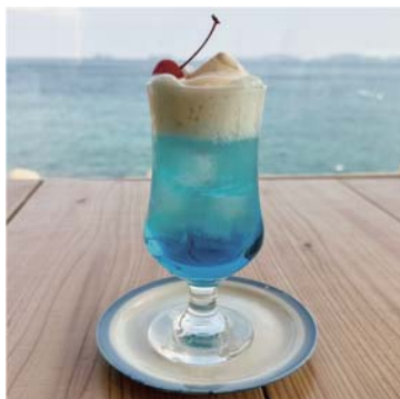
五島ブルーフロート 550yen