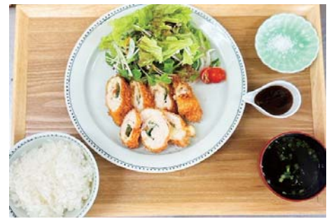
梅しそチーズチキンカツ 1,280 yen