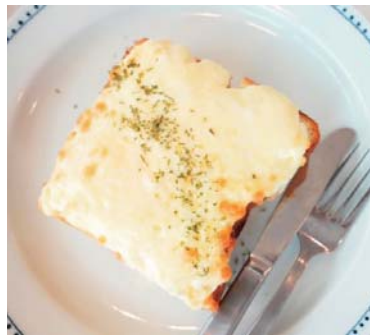
チーズたっぷり TORAPAN チーズトースト ……………550yen