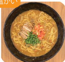
カレーうどん 1玉・1.5玉・2玉から お選びください 880 yen