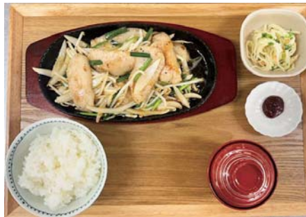
五島豚の 豚トロ旨塩炒 1,280 yen