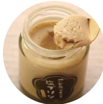
五島で食べる 塩プリン (かんころ味) 420yen