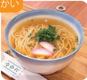
五島うどん 1玉・1.5玉・2玉から お選びください 720 yen