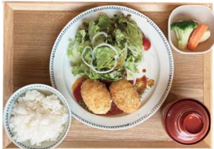
キノコとチキンの クリームコロケ 1,280 yen