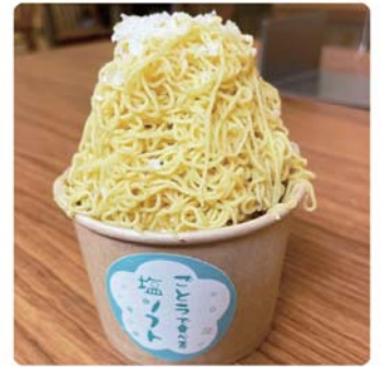
塩で食べる モンブランソフト ……………500yen