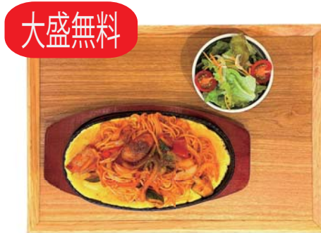
大盛無料 五島うどんナポリタン 980 yen