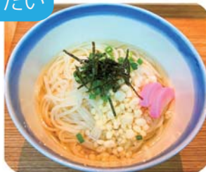
冷やし五島うどん 1玉・1.5玉・2玉から お選びください 720 yen