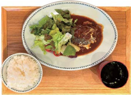
五島牛と五島豚の デミハンバーグ 1,280 yen チーズトッピング +150yen